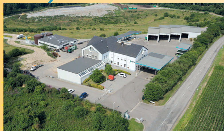
Mobiles Recyclingcenter / Centre de recyclage mobile